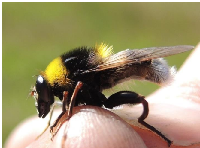
Gulstripet bjørneblomsterflue (VU).

Insekter er i liten grad kartlagt i kommunen, med unntak av humler som er relativt godt kartlagt. Kommunen har 20 av de 35 humleartene som finnes i Norge. Det er laget egne faktaark for slåttehumble og kløverhumble som er ansvarsarter for kommunen.