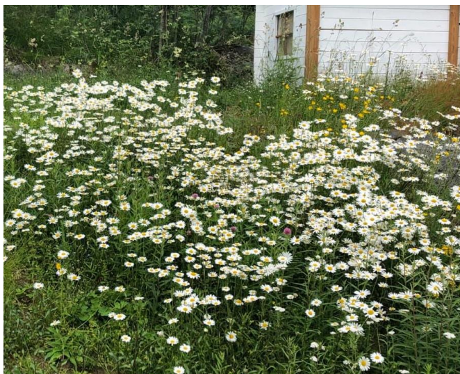
Plen som er gjort om til blomstereng.

Alle kan bidra til å bedre forholdene for insektene ved å gjøre om hagen eller balkongen til insekts vennlige hager/balkonger, og unngå å bruke sprøytemidler. I landbruket kan bønder tilrettelegge og avsette soner for pollinerende insekter.