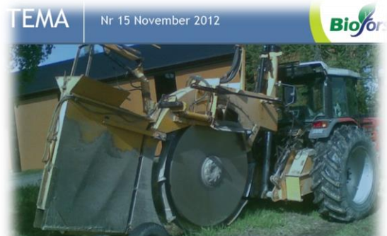
Lønnsomheten ved grøfting

Se temaark om lønnsomhet ved grøfting, mer fagstoff og lenker til nettsider om drenering på nettsiden til Landbruksdirektoratet .